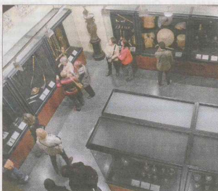
Les sales del Balaguer es van omplir la nit de dissabte