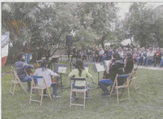
El primer concert del vespre, al Museu del Mar

Aquest públic familiar va acudir també als altres equipaments, però no va ser l'únic col·lectiu. Hi havia canalla que arrossegava els pares cap a la múmia, gent que preguntava si els Grecos eren de veritat, que si hi havia altres museus a Vilanova, el mateix entorn dels músics, descriu Mireia Rosich. L'assistència de persones de fora de Vilanova ha estat una de les sorpreses dels